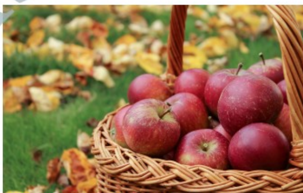
Nyplockade, ännu inte ätmogna, Ingrid Marie (vintersort).

*Trädmogna betyder att kärnorna har börjat bli bruna, medan äpplena fortfarande är kärva och hårda.