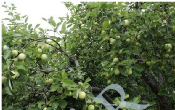
Transparente Blanche smakar allra bäst direkt från trädet.

Sommarfrukt mognar tidigt och bör ätas upp inom någon dag efter skörden.